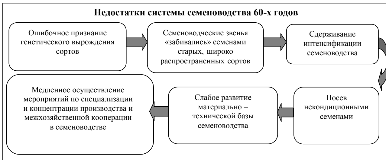
Рис. 2. Недостатки системы семеноводства 60-х годов

4 ноября 1976 года ЦК КПСС и Совет Министров СССР принимают Постановление № 915 «О мерах по дальнейшему улучшению селекции и семеноводства зерновых, масличных культур и трав», которое предусматривало: разработку и осуществление мероприятий по улучшению организации селекционно-семеноводческой работы по зерновым, масличным культурам и травам, по ускоренному созданию и внедрению в производство новых высокопродуктивных сортов этих культур, отвечающих требованиям интенсивного земледелия, а также по организации производства на промышленной основе высококачественных сортовых семян в специализированных семеноводческих хозяйствах и межхозяйственных объединениях и укреплению материально-технической базы селекции и семеноводства [8]. В 1976 г. начинается пятый этап развития системы семеноводства, продолжающийся до 1985 года.