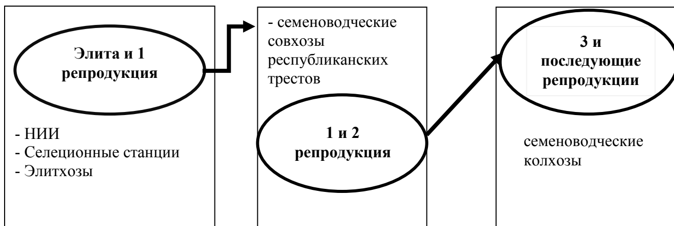
Рис. 1. Система семеноводства. 1931-1937 год

Была создана система селекции и семеноводства зерновых культур, объединяющая в единую систему селекцию, испытание и районирование сортов, заготовку и контроль за сортовыми (апробация) и посевными качествами (семенной контроль) семян.